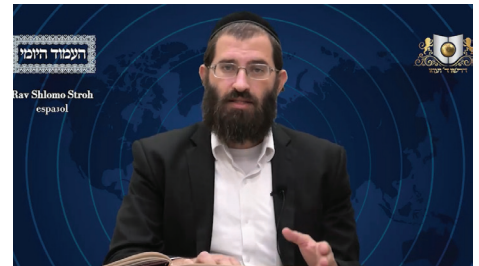
הרב שלמה סטרו שליט"א - ספרדית