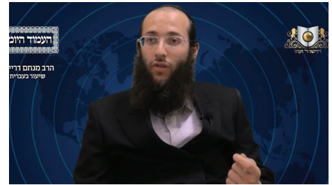
הרב מנחם דריימון שליט"א - עברית