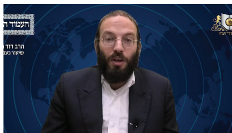
הרב דוד בוק שליט"א - עברית