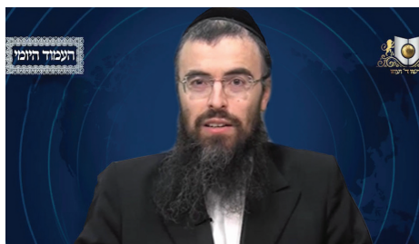
הרב אריה זילברשטיין שליט"א - עברית