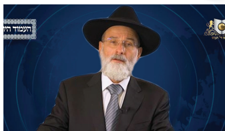
הרב דוד הופשטטר שליט"א - אנגלית