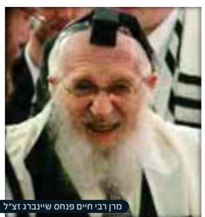
מר רבי חיים פנחס שיינברג זצ"ל

למרות שגדל באמריקה החומרנית והנהנתנית ואולי דווקא משום כך קידש רבינו עצמו ומגיל צעיר הרחיק את עצמו מהבלי ותענוגי עולם הזה מחשש שהם עלולים להפריע לגדילתו וצמיחתו. מרגלא בפומיה לחזור על דברי רז"ל שהתורה מעלה מטומאה לטהרה, מטבע הדברים דרגת קדושתו ופרישותו של אדם רם המעלה הינה בהצנע לכת ורב הנסתר בה על הגלוי, שכלל שראו וידעו ידע להסתיר מעיני כולם את פרישותו מהנאות העולם הזה, הוא עצמו לא נתפס בעיני הציבור כאדם פרוש מעולם הזה, והיה נראה טבעי עם כל אדם שהוא, אך אדרכה במקום שאתה מוצא ענוותנותו שם גדולתו וחסידותו.