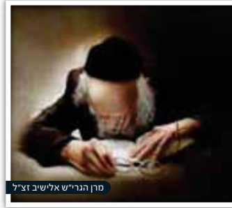
מרן הגרי"ש אלישיב זצ"ל

על ידיעותיו העמוקות של מרן החזון איש והתמצאותו המופלאה בכל תחום ועניין במכמני החיים, כתב בשו"ת שבט הלוי (ח"י סימן