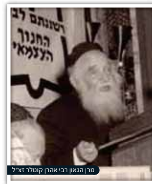
מן הגאון רבי אהרן קוטלר זצ"ל

כה התגלגלו הדברים, שאף בזמן ארוחותיו מוקף היה תמיד באנשים שבאו אליו עם בעיותיהם, ואכילתו ברוב הימים מהולה מרורים ולענה מצרותיהם של ישראל. הוא התעמק כל כך בעניינים שלהם, עד שלעיתים תכופות שכח מן האוכל לחלוטין, והיו צריכים