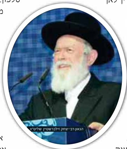
הגאון רבי יצחק זילברשטיין שליט"א