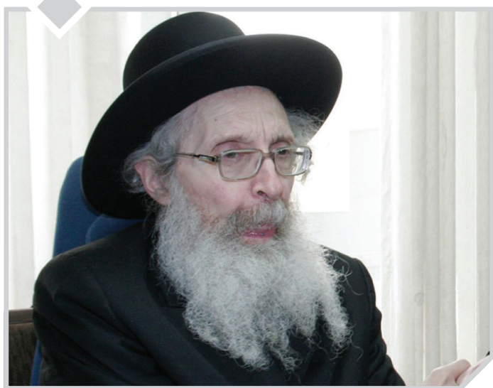
"אולי יש חמשים צדיקים" (בראשית י"ח, כ"ד)