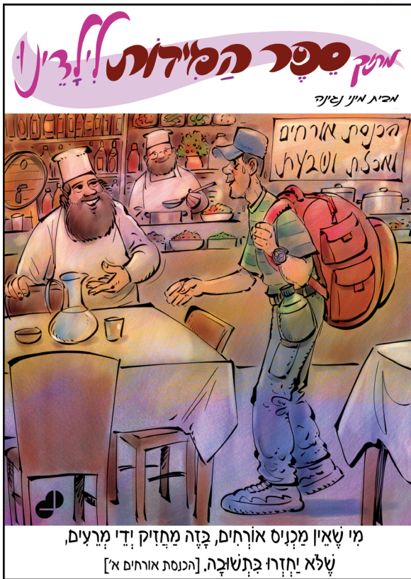
מי שאין מניין אורחים, בזה מחזיק ידי מרעים, שלא יחזרו בתשובה. [הנסת אורחים א']

הטובים והמפורסמים ביותר, שיטתו את בעלה מן האשמה ויבטלו את עניו, אולם כל מאמציה היו לשווא. גזר הדין נשאר על כנו: בעלה צריך לרצות את עניו ולשבת במאסר במשך שנתיים. את כל כספה הוציאה האישה לשלם לפרקליטים ששכרה, וכעת נותרה עניה, גלמודה ומלאה צער.