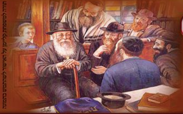
תורה למשפחת קלייטן על ראשי השנה לשרתנו בתמונה