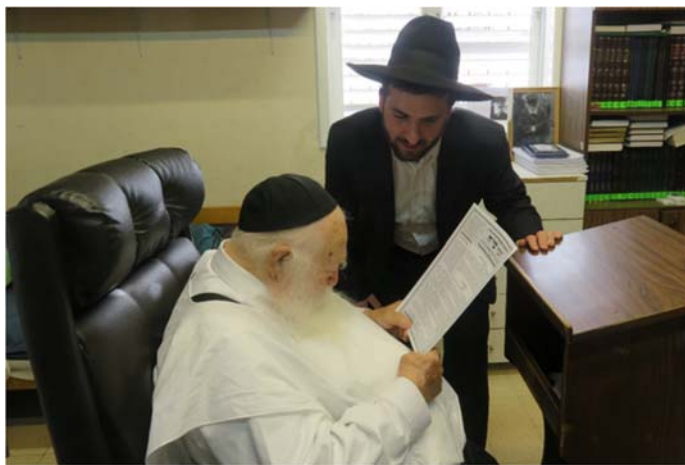
בתמונה: רבינו מעיין בגליון 'דברי שיח'.

כאן המקום להודות למאות התלמידי חכמים והקוראים ששולחים לנו דברי תורה ומסייעים בעדינו. יבורכו מפי עליון מדה כנגד מדה, שלא תמוש התורה מפיהם ומפי זרעם.