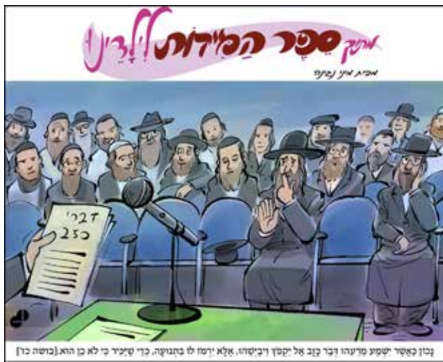
[בן קאשר ישיבת מרעהו דבר קנב אל יקסד רבישדו, אלא ירמו לו בתוניה, כדי שיכיר כי לא בן הוא. [בושה כז]

יהודי אחד ש ש ש של הבטחתו של רבי אלימלך מליז'ענסק אשר הבטיח כי כל מי שיגיע על ציונו הקדוש לא יעזוב את העולם הזה בלי תשובה זו החליט בלבו