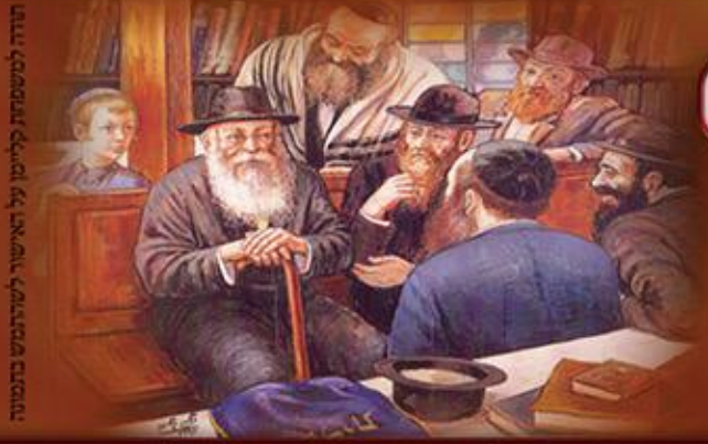
תורה למשפחת קלייטן על ראשיהו לשריתמש בתמונה