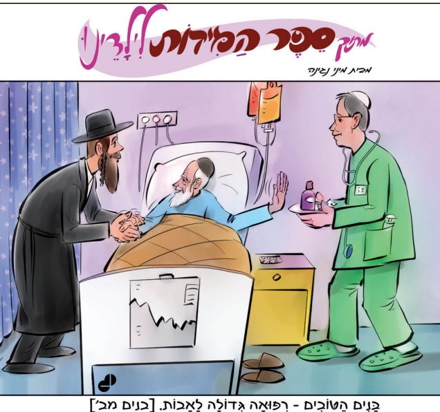
גנים מטובים - רפואה גדולה לאבות. [גנים מב']

הרב שמע את דבריו, אך ציין שהיות והכסף אינו שלו, לפי דין תורה מחויב הלווה או להישבע שהשיב את הכסף ויפטר מתשלום נוסף, או שישלם שוב כדי לא להישבע. הלווה שהיה איש ירא אלוקים