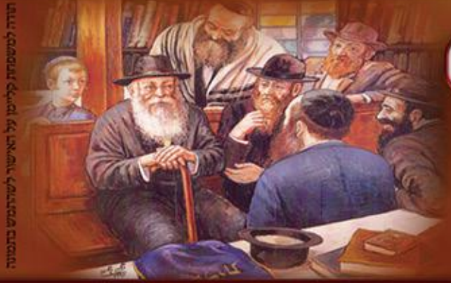
תורה למשפחת קלייטן על ראשי לשרית בשנת