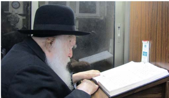
כל הזכויות שמורות ©

נחלקו הפוסקים אם נשים יכולות לספור ספירת העומר בברכה, ד"א דאיכא למיחש שישכחו ולא יספרו כל הימים, ולאותם דיעות שכל ימי הספירה היא מצוה אחת ארוכה, אם לא יספרו חלק מהימים יוצא שהם יבטלו את המצוה. ולמעשה הרבה נוהגות לספור בלי ברכה (ועי' מ"ב ס' תפ"ט סק"ג). אמנם דעת רבינו שליט"א, כי אף נשים ראוי שיחייבו את עצמם במצוה יקרה זו של ספירת העומר, ויכינו לעצמם תזכורת במקום בולט, כדי לזכור בכל יום לברך, ואז יוכלו לספור בברכה. וכך נהגה הרבנית ע"ה, והבנות בבית רבינו. וסיפר עוד: כי בבית אביו מרן הסטייפלר זצוק"ל, היו הבנות - אחיותיו של רבינו סופרות עם ברכה, ומרן זצוק"ל היה שם תזכורת במקום בולט, שלא ישכחו כל ערב לספור. איזה מקום בולט אפשר לשים כדי שהבנות בודאי יראו? מרן זצ"ל שם פתק על... המראה שבה היו מביטות הנשים... כך בודאי יראו את זה.