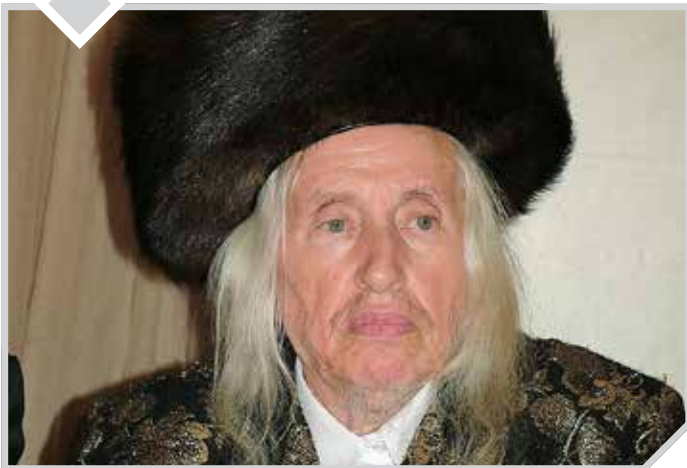
"אמור אל הפְּהָנִים" (ויקרא כ"א, א')

חז"ל במסכת יבמות (קיד, א) מדייקים בלשון הפסוק: "אמור אל הכהנים בני אהרן ואמרת אליהם". מדוע נאמר 'ואמרת' לאחר שכבר נאמר 'אמור'? אלא, לומדים חז"ל, שהכפילות באה "להזהיר גדולים על הקטנים".