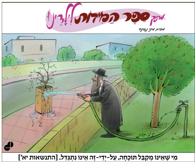
מי שאינו מקבל תוקחה, על-ידי-זה אינו נהגדל. [התנשאות יא']

כ כ ל ש ג ר ו והתרבו חיוניהם של הטבריינים, עלה מפלס ה ח מ ס והזעם בלבו ה ר צ ח נ של המושל ה ס ו ר י, ש נ ו כ ח שפגיעותיו ח ד ל ו מ ל ז ר ו ע ח ו ר ב נ ו א ב ד ו ת בעיה לאחר ד ר י ש ה ו ח ק י ר ה מ א ו מ צ ת