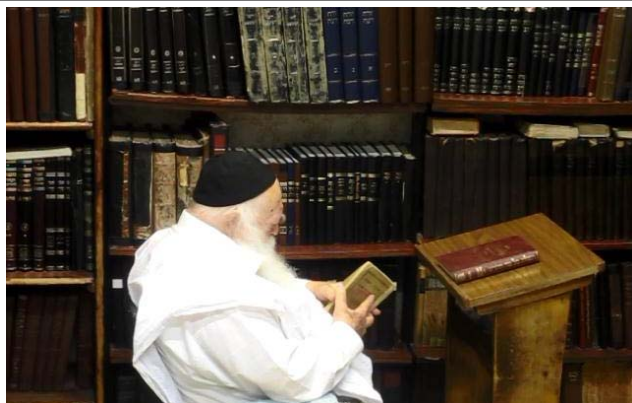
כל הזכויות שמורות ©

ולואי ונזכה להגיע לדרגת ה"ירא שמים שהוא מיצר ודואג על החורבן" (ש"ע סימן א' ס"ג)