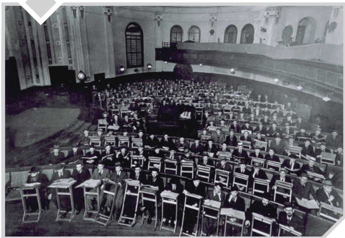
תלמידי ישיבת מיר בשנחאי

מדוע נשארו תלמידי ישיבת מיר תחת מטר הפצצות?