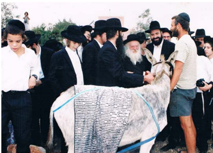
כל הזכויות שמורות ©

יזכנו ה' לעשות כל המצוות ולעסוק בתורה בשמחה תמיד.