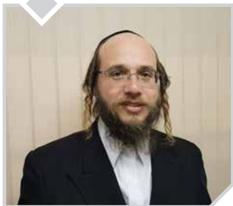
הרב יחיאל יהושע גולדברג

שיחה עם עובדי 'דרשו', בשולי המעמד הכביר שהתקיים ב'בנייני האומה' ופתח את שרשרת אירועי סיום הש"ס בארץ ובעולם