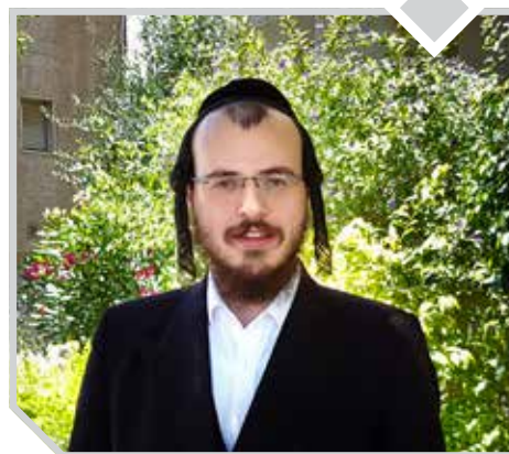
הרב שמעון דייטש