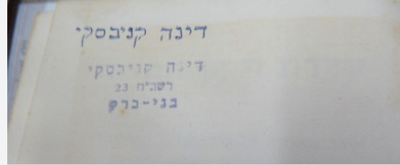
רבינו רשם את שמה של בתו הילדה, בכתב נאה ומעטר על המחברת דבריו - חול בו למדה בבית הספר

בנושא זה היה משקיע את תמצית כוחו. עוד בילדים קטנים ממש, הכין רבינו 'לוח אותיות' נאה כתוב בכתב גדול, כדי להנעים לילדים את לימוד האותיות (את הלוח הראשון הכין רבינו הקהילות יעקב זי"ע לנכדים הצעירים, וכשנשבר הכין רבינו לוח חדש ונאה ורשם עליו אותיות בכתב יפה), וגם בהמשך היה משהדל לקנות להם ספרים נאים, ואף מעטר עליהם את שם התלמיד בכריכת הספר.