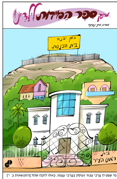
מי שמניח צרכי צבור וטוסיק בצרכי עצמו, כאלו לוקח שחד [התנשאות ב' י']

ובביתה של היהודיה העניה שמחה וששון על הנס הפילאי שנעשה להם י'ס משלוח מנות מן השמים. היא סיפרה לחברותיה את דבר הפלא של משלוח מנות: בודאי היה זה אליהו הנביא זכור לטוב, שהביא לה מנות יפות כאלו, אמרה לכולן. אך יהודי ברדיצ'ב הבינו כי רבם מילא הפעם את מקומו של אליהו הנביא. ודאגו לשלוח משלוחי מנות לרבי לוי יצחק ביד רחבה. מובן מאילו כי הם לא שכחו גם את העניה, ילדיה ובעלה החולה.