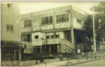
תלמוד תורה 'תשב"ד' בבני ברק, בימים ההם.

פעם התבטא רבינו כי ראה מהנסיון שעל כל אבא לברר מפעם לפעם אצל המחנכים של הילדים, על התנהגות הילד, מי שלא מתעניין נוהג שלא כראוי. והוסיף, פעם אמר לי אחד המלמדים 'אבא שלא מתעניין מהבן שלו, שלא אכפת לו ממנו, גם לי לא אכפת ממנו!' (ספר מנחת תורה).