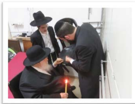
הכנה כפולה לזמני לחץ, לדאוג להיות רגוע ביותר. רבינו בבדיקת חמץ בסבלנות ורוגע במשך כשלוש וארבע שעות.