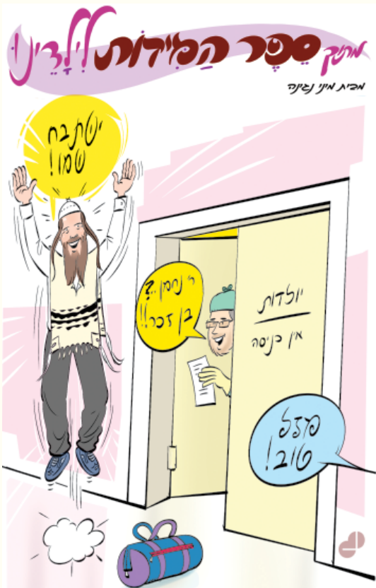
מי שהוא רגיל לומר בשורות טובות, הוא נתלבש מבחינת אליהו (בשורה א')

סיפורנו מתמקד בתקופה של עשרים השנים (!) בהן כתב מרן רבי יוסף קארו את ספרו הבית יוסף. באחד הלילות נכנס הבית יוסף לבית המדרש