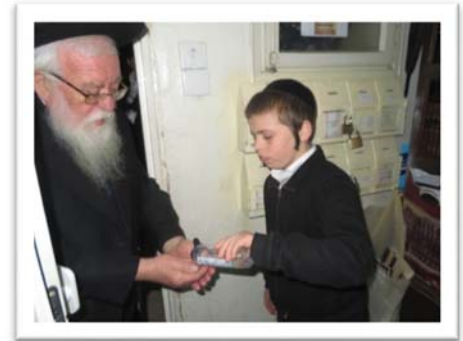
תקופת קורונה שנת תש"פ: בני הבית נזהרים במצות הבריאות, ובכניסה לביתו של מרן שליט"א שמים בחיך על היד חומר חיטוי.

נדרשנו לנושא זה בעקבות בקשת רבים מקוראנו שיח'י, עקב התקופה האחרונה שנועדה לנו מן השמים, בו המשפחות והילדים נצורים בבתים כל היום, ובמקרים רבים ההורים או הילדים נמצאים במתח ובלחץ מהמציב, והתגובות הבלתי צפויות יכולות להיות חלילה הרות אסון לדורות. פשוט וכמובן, כי נדרשת זהירות בשמירה על כללי הבריאות, כמו שציוותה תורה ונשמרתם מאוד לנפשותיכם, אבל המתח הקיים סביב הנושא הוא רחוק ממצות 'ונשמרתם', ואדרבה, זה מרחיק את הנפש משמירת התורה.