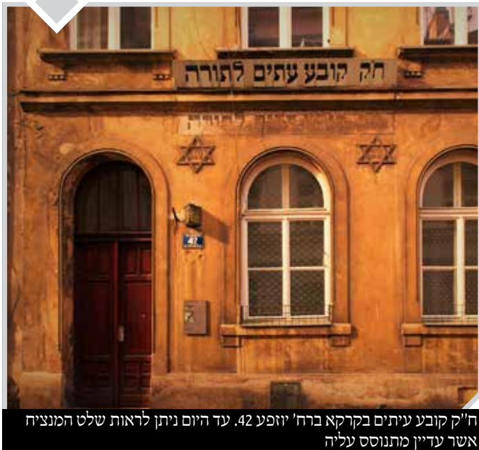
ח"ק קובע עיתים בקרקא ברח' יוזפכ 42. עד היום ניתן לראות שלט המנציח אשר עדיין מתנוסס עליה

גם שהרי 'אין נחמה כנחמת התורה' שעליה הכתוב אומר (תהילים ט) שהוא משיבת נפש, והיא הנחמה האמתית.