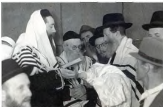
מרן החזון איש זצ"ל משתתף בברית מילה. לצידו הגאון רבי דניאל מופשוביץ

מעניין להוסיף, כי בניגוד למה שיש החושבים, כי בימינו כל מערכת החשמל פועלת על ידי אוטומט ללא צורך במגע יד אדם, ההיפך הוא הנכון. בספר מיוחד 'החשמל בשבת', שהתחבר על הנושא, ונכתב על ידי הגאון ר"מ מורגנשטרן שליט"א, הוא מקיף את הנושא לאורכו ולרחבו, ומביא בין השאר את דברי רבינו שליט"א, הוא מאריך שם להוכיח כי דווקא כיום הנושא חמור הרבה יותר מפעם, כי אין האיסור רק מצד חילול השם, אלא חילול שבת אמיתי, היות והשתמשות בחשמל בשבת גורמת לכך שפועל יהודי יחלל את השבת ממש עבור המשתמש. טענה זה שומטת את הקרקע מתחת כל ידי אלו שהתירו עד היום. (ואין כאן המקום להאריך).