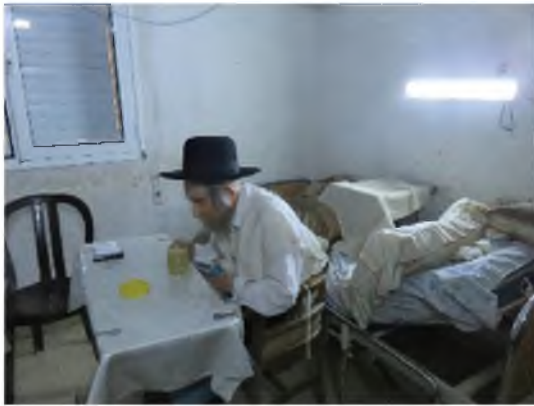
פי אִשְׁבַּח בְּחֶשֶׁךְ ה' אִור לִי: תמונה נדירה של רשכבה"ג הגראי"ל שטינמן זצוק"ל לוגם מכוס המשקה ביום חול, כשלפתע כבה החשמל, ונורת החירום שמאחוריו נדלקה, הוא סירב להמשיך לשתות עד שיאיר החדר, מחשש שיש במשקה חרק וכדו' שאינו מבחין בו.