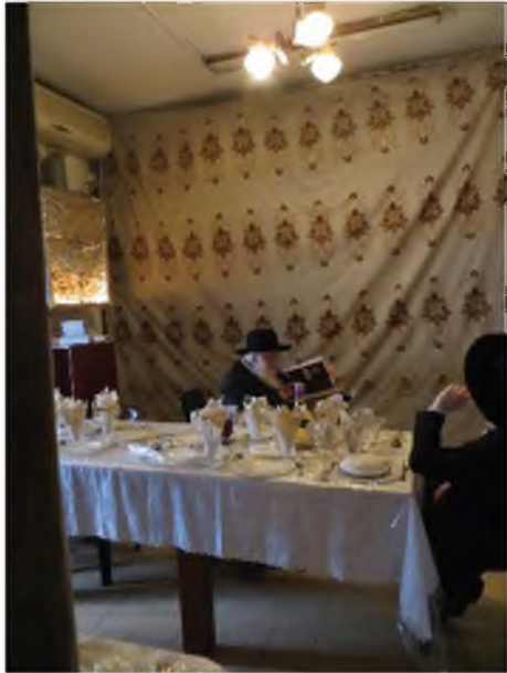
רבינו לומד בביתו בכניסת השבת, כשהוא בחדר הוא מתאורת 'לוקס' ולא מחשמל.

גם בבית רבינו שליט"א, מסיבה זו אין חשמל רגיל בתאורה לשבת, רק מנורות לוקסים שמפיצים אור ורום, (ולאחרונה הוסיפו מעט אור צהוב).