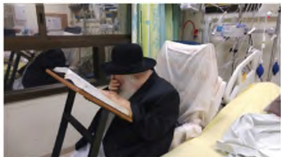
גנרטור גם בבית חולים. רבינו בבית הרפואה 'מעייני הישועה' לפני מספר שנים.

(מפי מר נא. שיח"י חבריו לספסל הלימודים דאז, בראיון מיוחד שהעניק למערכת 'דברי שיח', שיפורסם א"ה בהזדמנות).