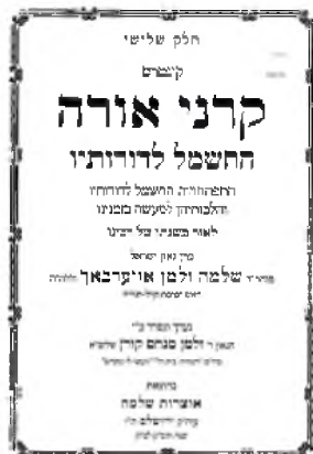
אחד החיבורים אודות נושא החשמל