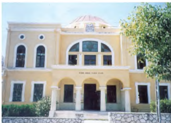
ישיבת לומז'א בפתח תקוה, כיום

רשכה"ג מרן החזון איש זצוק"ל, בתוקף יראתו, נדרש לסוגיא בשנתיה הראשונות של קום המדינה, והוא התייחס בחומרא רבה מאוד לשימוש החשמל המיוצר על ידי יהודים, אבל מהיבט שונה לגמרי: חילול השם. מרן זצוק"ל סבר (עי' חזו"א או"ח סימן ל"ח סק"ד) כי גם באופן שיש היתר להשתמש בחשמל מצד הדין, מכל מקום יש כאן איסור של חילול ה', היות והוא שימוש ציבורי, והפועלים העובדים בשבת הם עושים במרד רח"ל, והנהנה ממעשיו מעיד ח"ו שאין ליבו כואב על חילול השבת, את דבריו הנחרצים הוא מסיים בתפילה "ויהא רעוא שישובו בתשובה שלימה במהרה".