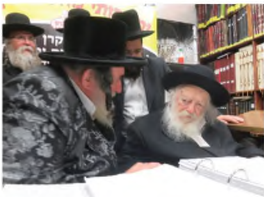
האדמו"ר מויז'ניץ במעונו של רבינו שליט"א

על סיפורי ניסים, מופתי פלא של אנשים שזכו לדברים לא טבעיים בזכות ובעבור טירחתם למען השבת, ניתן לכתוב ובשפע, אך אין מקום ביריעה זו כדי להכיל את הכל, אבל ברכת השבת התקימה תמיד, המלוה לשבת - היא פורעת לו בכפל כפלים. מְעַנְיָה לְעוֹלָם כְּבוֹד יִנְחָלוּ. טוֹעֲמִיָה חַיִּים זָכוּ.