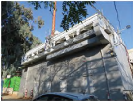
מתחם גנרטור ענק בלב ליבה של העיר בני ברק. תשפ"א.