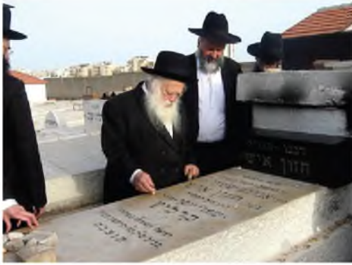
המשיך את מה שהחזון איש התחיל. רבינו שליט"א בקבר רבו מרן החזון איש

גם באלפי מכתבים שהשיב הוא בולט בקו האמיץ שיצוק בניחוח החזון איש, הוא פוסק למעשה לעשות כל מאמץ כדי שלא ליהנות מאור שאינו כשר, הוא