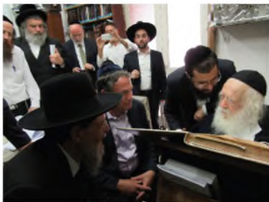
הסוד שגם הרחוקים משמירת מצוות ידעו. למצלומים אין כל קשר לכתבה.