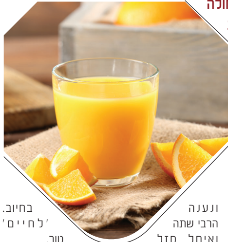
בחייב. 'ל חיים' טוב.