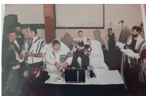
תמונה נדירה של מרן שליט"א יושב על כסא הסנדק, כשבחזית הנדירה נראה המוהל הרב שקול

הוא עושה כדן. רבינו מאיר פנים למוהל הרב שקול (לבוש בקיטל לבן כמנהגו) אחרי ברית מילה שערך. (ברכת יש"כ לנוכח רבינו, ידידנו הגאון רבי אריה קולדצקי שליט"א)