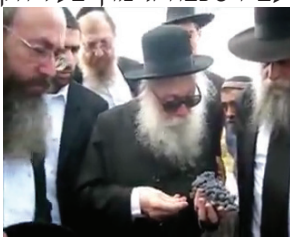
מרן הגר"נ זצ"ל בכרם ענבים שבפיקוחו