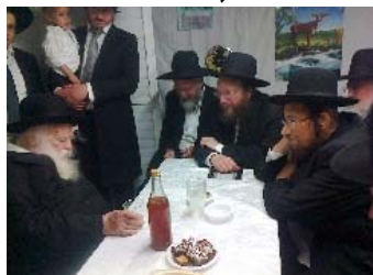
רבינו שותה 'לחיים' בחול המועד סוכות, בסוכתו של הגרי"ש ז"ל כששהה בסוכות בבני ברק