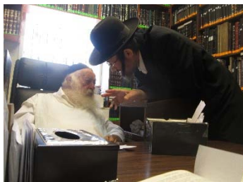
הגרי"ש קרליבך זצ"ל עם להבחל"ח רבינו מרן שליט"א