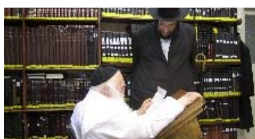
קעבדא קמיה מריה