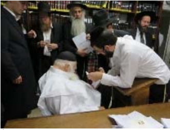
זכרונות מערב שמיטה. קבלת קהל של רבינו בשנת תשע"ה