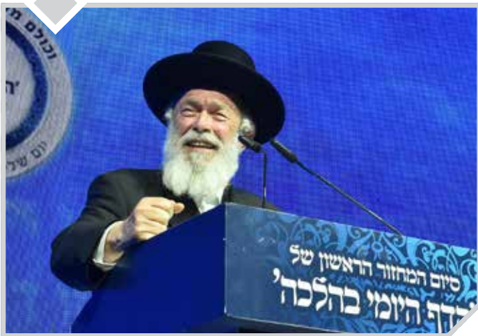
"ועשו להם ציצית" (במדבר ט"ו, ל"ח)