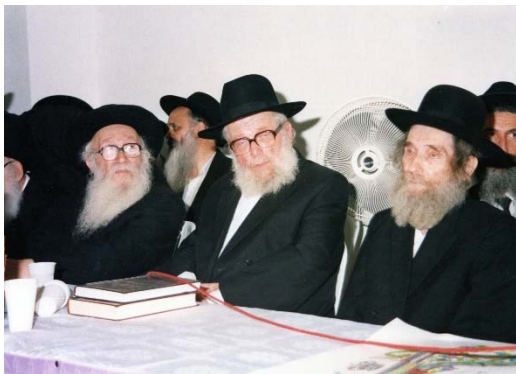
מרא דאתרא דקרית ספר הגר"מ קסלר זצ"ל עם גדולי הדור ז"ע (תודתנו לבנו הגאון רבי משה שליט"א)

במסעותיו ברחבי הארץ לשמש כסנדק בבריתות, היה מבקר רבינו כמעט בכל שבוע בעיר מודיעין עילית, קרית ספר, בחזרתו הוא היה אומר בהנאה, 'מרגישים לפי השאלות, כי זו עיר שגרים בה בני תורה'. כי בכל ברית היו מתקבצים סביבו אברכים בני עליה ומנצלים את הרגעים המועטים בקרבתו, לשאול כמה שאלות שעל הפרק.