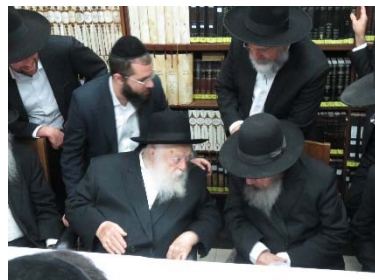
רבינו שליט"א עם הגר"ד שליט"א

ארבעה ימים אחרי, הריץ לו הגר"ד שליט"א מכתב תגובה, והוא מגיב לו על הדברים "ומה יב הצער, על אשר תמורת שתבוא על בטויה הראוי והשלם, הכרת תודתי על הנכונות וטוב החסד, אשר יגלה הדרתו לברור ספקותי מידי פעם בפעם, נתעורר פקפוק חשש בלב הדרכ"ג שליט"א, כאילו קיים ההיפך מכך, ואבקשה מאוד מהדרתו שימחלו לי על שבגיני נגרם צער להדרתו".