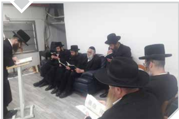
שיעור דף היומי בהלכה בהפסקה בספערל בקרית אתא

נבחני ה'דף היומי בהלכה' לקראת הסיום הגדול חורף תשפ"ב