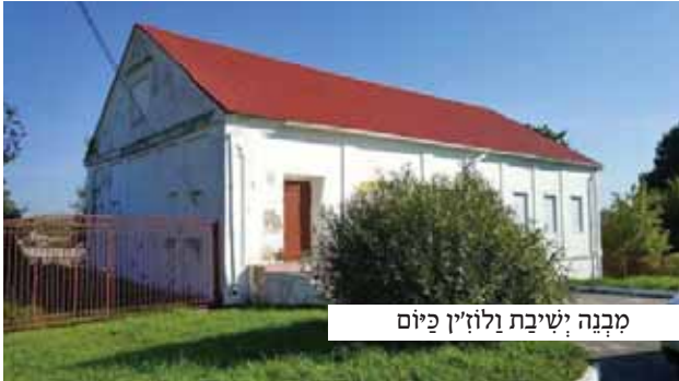
מבנה ישיבת וולוז'ין כיום

המום ומבלבל עמד התלמיד על מפתן האולם המפאר כשמחו תפוס בהרהורים; היתכן כי לכאן נשלח בידי רבו? היתכן כי עשיר זה שזכר בעליל כי אינו יודע מחסור מהו, יוכל ללמוד את גדר הבטחון וההשתדלות!?