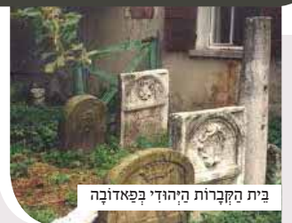
בית הקברות היהודי בפאדובה