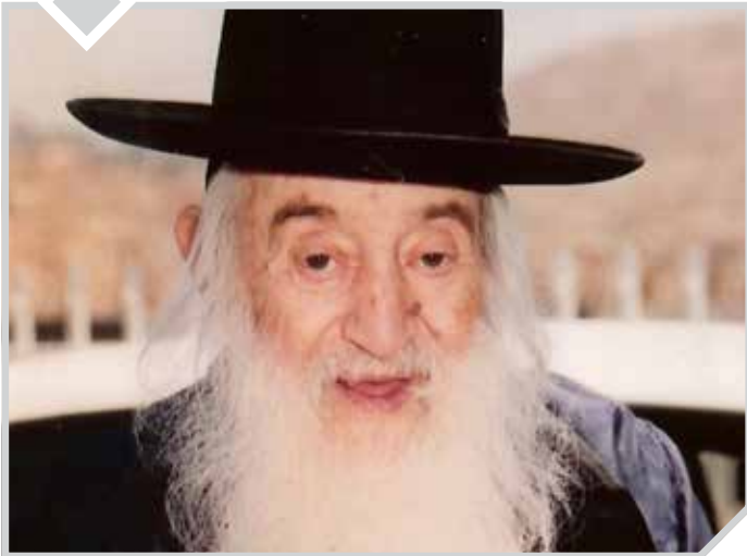
רבי נתן מאיר וואכטפויגל