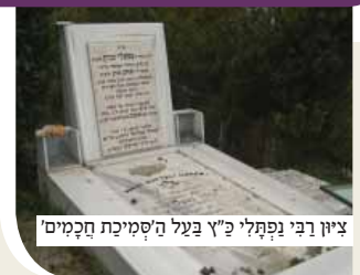
ציון רבי נפתלי כ"ד בעל ה'סמיכת חכמים'

רבי נפתלי כ"ץ נולד בשנת ה"א ת"כ בעיר אוסטרצה שבאוקראינה לאביו רבי יצחק הכהן.