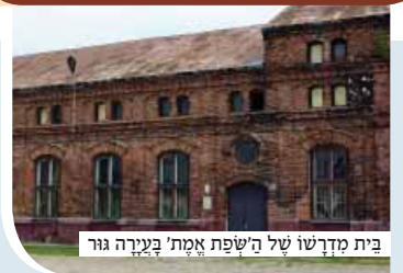
בית מדרשו של השפת אמת בעירה גור