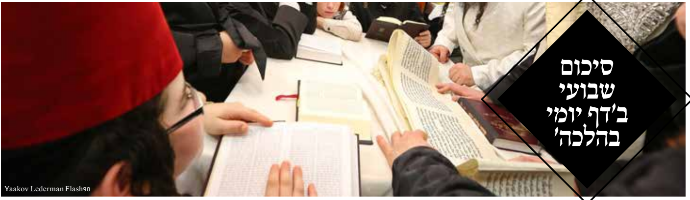
Yaakov Lederman Flash90