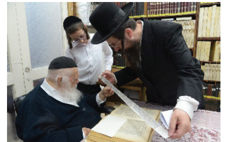
רבינו בוחן פרשיות תפילין עבור נער בר מצוה