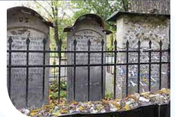
מימין מצבת הרמ"א, משמאל מצבת אחות הרמ"א מרת מרים, בפורץ מצבת אביהם רבי ישראל איסר.