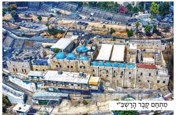
מתחם קבר הרשב"י

שלושה ימים לאחר ל"ג בעומר התחולל מפנה מעודד. הרב ש. העבר ממחלקת טפול נמרץ למחלקת שקום נשימתי. אלא שהרופאים מהרו לצנן את ההתלהבות באומרים כי הם עדין סבורים שאין לו סכויים רבים להצליח להשתקם.