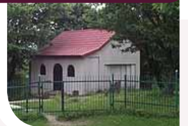
האהל על ציונו של רבי מנחם מנדל מרימנוב ז"ע