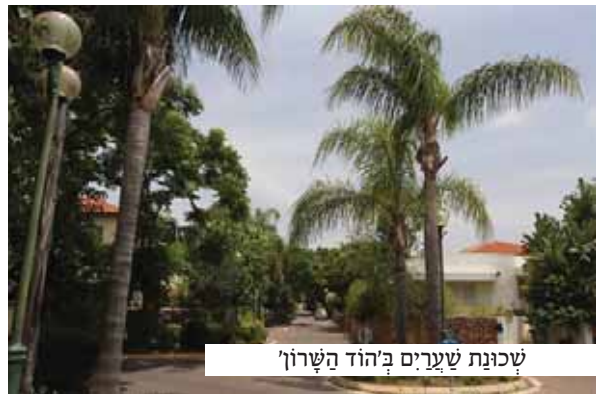
שכונת שערים ב'הוד השרון'

היה זה בשעת אחר צהרים מאחרת, בעצומו של 'סדר ב' בהיכל הכולל. האוירה הרועשת והגועשת מ'ריתחא דאורייתא' של עשרות הלומדים, גרמה לכך שאיש מבין הלומדים לא שם לב לשתי הדמיות שנועמדו בפתח בית המדרש בצעדים כושלים והתבוננו בסקרנות ובתדהמה באברכים שהיו שקועים בסערת למודם.