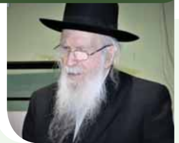
הגרמ"י ליפקוביץ זצ"ל