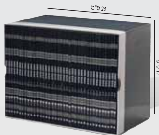
* כריכה רכה, פורמט כיס, 38 חוברות