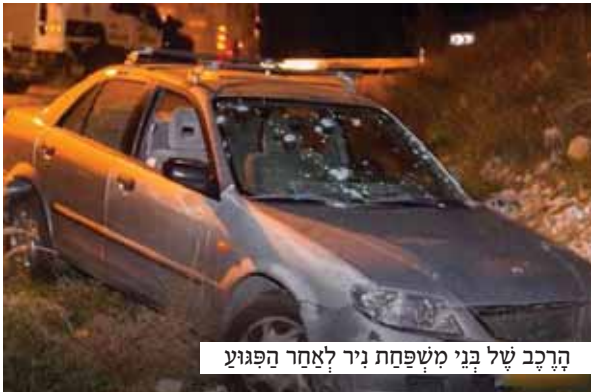
הרכב של בני משפחת ניר לאחר הפגיעה

ופתאום השתרר שקט. היריות פסקו. בד בבד נעצר לצדם רכב, שממנו יצא איש בעל חזות ערבית, לבוש בגדים בהירים. האיש נגש אליהם ולבם נפל מפחד, האם הוא היורה?! האיש הביט בפצוץ מערפל ההפצה ושאל את רעייתו לשמו.