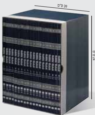
* כריכה רכה, פורמט רגיל, 19 חוברות