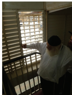
תמונה נדירה: מגיף את תריסי הבית

בערב ימיו, הזדמן לדבר אודות הסבא הקדוש בעל הלשם, ורבינו פנה אל בנו רי"ש ואמר לו - הלמדת פעם בספריו? משהשיב בשלילה, אמר לו בוא ואלמד אותך כיצד לומדים בו. אך לא אסתייע מילתא.