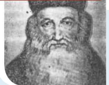
המהר"ם בנעט ז"ע