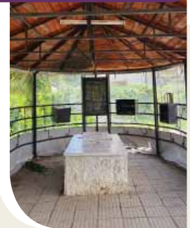
מתחם קבר הפלא יועץ בסיליסטרה שבבולגריה