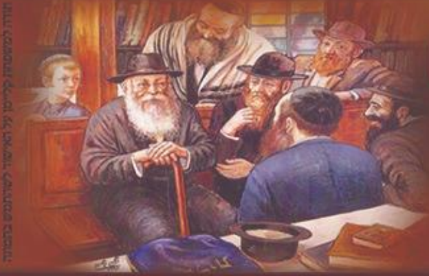
תורה למשפחה קייטום על האישור לפרויקט המבית