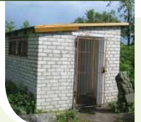
אהלה על קברו של רבי אהרן מז'יטומיר ז"ע