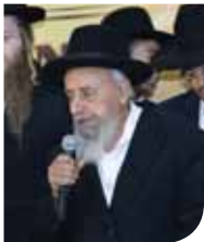
מרן הגאון רבי שמעון בעדני שליט"א ראש מוסדות 'תורה וחיים' וזמן חברי מועצת חכמי התורה

נותנת כח לקיים הברכה. לכן דקדקו חז"ל והפליגו כל כך בהירות הנדרשת בעניית אמן. אנו לפי דרגתנו איננו מבינים מה כבר עשינו... אף האמת היא שפיון שהננו בעלי נשמה שהיא חלק אל-ה ממעל, לפיכך הפעלות שלנו פועלות ומשפיעות בעולמות העליונים, לטוב, ואף חלילה לנוטב, לכו עלינו להזהר בזה כל כך. אמן היא 'בסוף הכל' הבעת אמן בברכה, אבל למעלה מזאת יש בה כח עצום לתקן בעולמות העליונים. לפיכך אם נוהגים בה פיאות וכהלכה, אין ערך לגדלות השכר - 'פותחין לו שערי גן עדן'. לפיכך אף השומר 'אמנים' נקרא 'צדיק' כי הוא בונה ומתקן עולמות ומוריד שפע טוב לעולם.