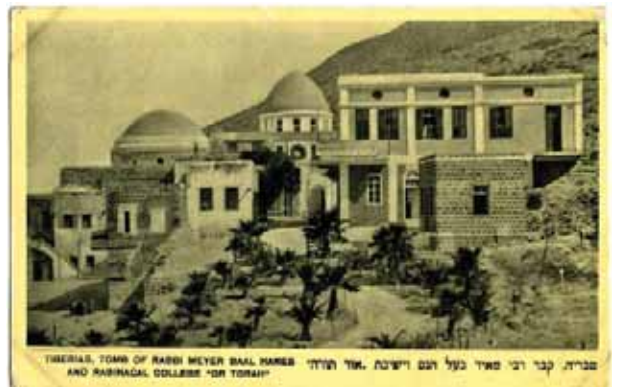
גלויה עתיקה של קבר רבי מאיר בעל הנס וישיבת 'אור תורה' שהוקמה בצמוד אליו

עודו שקוע בתפלה והנה חש הוא במגע יד על כתפו. הוא פקח את עיניו וגלה מולו קשיש ישמעאלי הנושא על גבו שק כבד גדוש 'לדר', אותו ממתק נודע העשוי מפרי המשמש. הישמעאלי הציע לו לרכש ממנו את סחורתו.