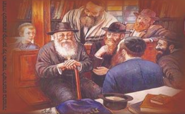
דודו למשפחה לקיים על האישור לפרסום בלבד