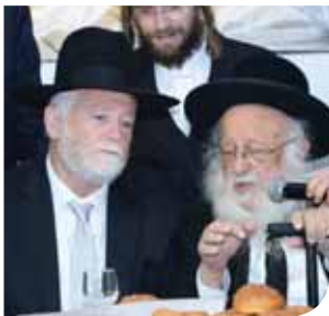
הגאון הגדול רבי ברוך דב פוברסקי שליט"א ראש ישיבת פוניבז'

אמנם כתבו הפוסקים שאף לדעת הסוברים שיטת לברך ברכה זו בלחש, אם ברך אדם ברכה זו בקול על השומע לענות אמן אחריו (מסגרת השלחן' על קיצושו"ע שם; משנת התפלין' עמ' רמה בשם הגר"ש אלישיב). ואולם הי"פ החיים' (או"ח כה מ) כתב שהשומע ברכה זו לא יענה אמן בפיו אלא יהרהר בה בלבו.