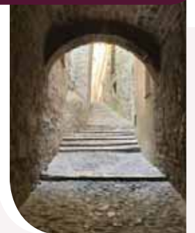
סמטה ברבע היהודי בגירונה שבספרד

החסיד רבנו יונה ב"ר אברהם גירונדי, מגדולי הראשונים שפעלו בספרד, נולד בסביבות שנת ד' אלפים תתק"ע.