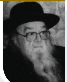
המגיד הירושלמי רבי שלום שבדרון זצ"ל