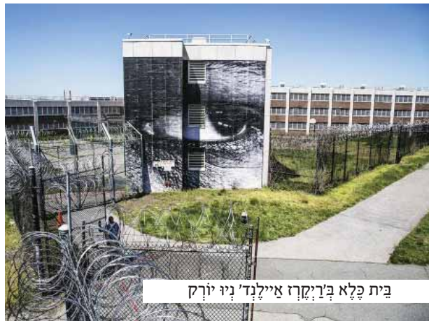
בית כלא ב'ירוק איילנד' ניו יורק