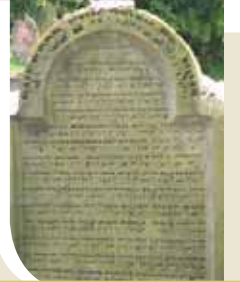
מצבת בעל החות יאיר בבית העלמין בוורמייזא