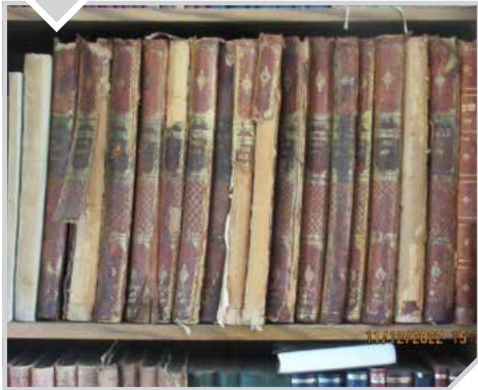
הש"ס העתיק שנטמן באדמה ושרד את השואה

שהוצאותיה עשויות להכפיל ולהשליש את עצמן ויותר. "היזומה אינה מתאימה", אמרו, "ליחיד העמל בכוחות מצומצמים, בחדר שאינו אלא ארבע אמות רבועות, נעדר כל משאבים שבהם כרוך פרויקט כה ענק". אך הטענות הללו, למרבה הפלא, לא מצאו להן אוזן קשבת: