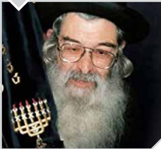
"בְּחֶרֶב־וּבְקִשְׁתֵּי" (בראשית מ"ח, כ"ב) בצלותי ובבעותי