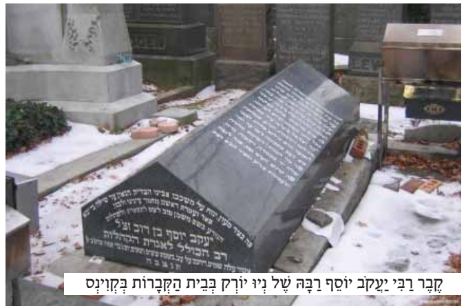
קבר רבי יעקב יוסף רבה של גני יורק בבית הקברות בקווינס

בדרך לבית החיים בקווינס אל מקום קבורתו של הצדיק, לא יכלו שלא לחשב על צערה של אם החולה שכבר אבדה בת אחת, ועתה עמדה לאבד את השניה. למרות המצב המימשל הן החליטו להתפלל בכל לבן לפני הכל יכול, באמונה תמימה שכפי שבידו להחיות מתים ברחמים