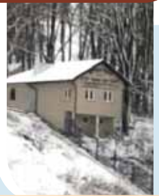
האהל על מקום קבורתו של בעל ה'בני יששכר' בעיר דינוב