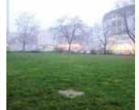
המקום עליו עמד בית הכנסת בעיר מטרסדורף (לשעבר 'מטרסדורף') שבאוסטריה, שנהרס על ידי הנאצים מ"ש

חדושי על המשניות היו בידי החתם סופר, ובהשתדלות בנו רבי שמעון סופר מקראקא שבצו במהדרת משניות לעמברג תחת השם 'בני יששכר' - זאת לפי שלא השאיר אחריו בנים. במכתב הסכמתו להדפסת משניות אלו, כתב רבי שמעון סופר כי אביו החתם סופר היה 'מפליג מאד בשבחי תורתו וקדושתו' של המהמבר.