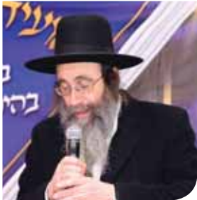
הגה"צ רבי בנימין פינקל שליט"א משגיח ישיבת מיר