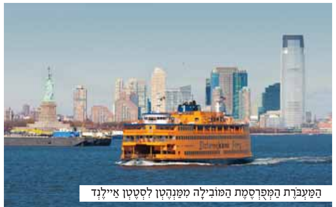
המעברת המפרסמת המובילה ממנהטן לסטון איילנד

ר' אורי לא חשב פעמים. לא היה לו הזמן להתנצל ולהסביר... הוא חטף את הסדור מידי האיש ומהר לעבר חדרו של החולה. הוא אמר את סדר הודוי ואת הפסוקים שרגילים לומר בשעה זו, וברגע שסיים - יצאה נשמתו של החולה ושבה לכור מחצבתה. כך זכה אותו יהודי בודד וערירי להשיב את נשמתו לבוראה בכבוד הראוי.