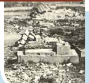
הריסות בית הקברות היהודי בלבוב. צלם בשנת תש"ב

נתן לשלח מכתבים לפקס שמספרו 08-9746102 או לכתבת המייל: 9139191@gmail.com