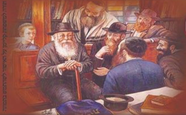
דודו למשפחה לקיים על האישור לפרוייקט ביהמ"ד