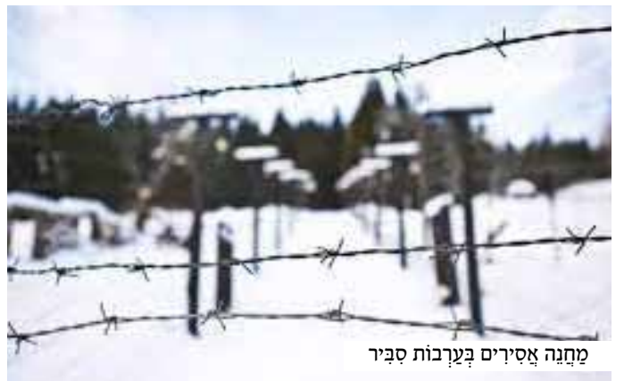
מחנה אסירים בערבות סביר

ר' יעקב פתח את הדלת והשתחל לתוך הבקתה. אותו יהודי אלמוני המשיך בשירתו מלאת הערגה והגעגועים לאביו שבשמים, עד כדי כך שלא הרגיש ולא הבחין כלל בכניסתו.