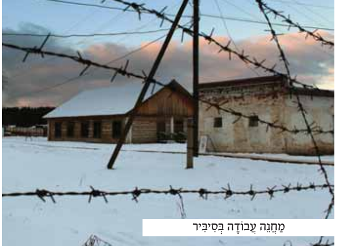
מחנה עבודה בסיביר

הייתי באפיסת כוחות, וכמעט נכנעתי לקול שהדהד בתוכי. כאשר לא הייתי מסוגל יותר לסבל, זעקתי בתפלה לה': 'רבוננו של עולם, רחשו שפתי, עזר לי! אינני מסוגל יותר להלחם, עשיתי והתאמצתי למען כבוד שמה, וכחותי כבר אוזלים. אָנָּה ה', עזר לי שלא אאלץ לחלל את השבת!'