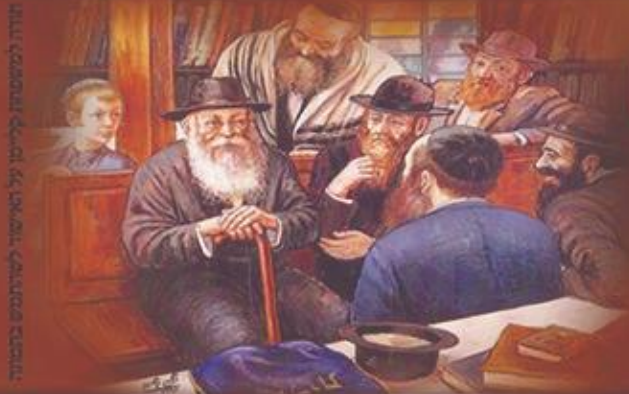
דודו למשפחה קיימין על האישור לפרסום בלבד