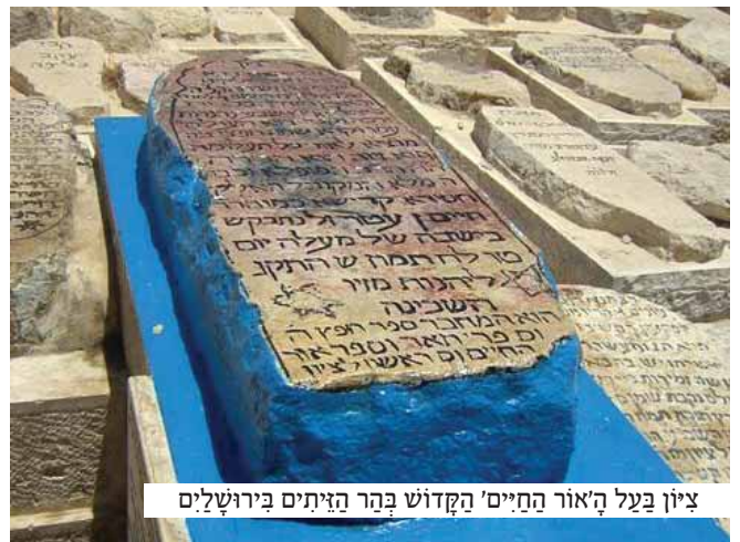
ציון בעל האור החיים' הקדוש בהר הזיתים בירושלים

ביום שלמחרת, כאשר הופיע הזקן בפתחנו כפי שנהג לעשות מדי יום בתקופה האחרונה, הודעתי לו בלשון תקיפה שאינה משתמעת לשני פנים, שאין לו מה לעשות שוב בביתנו, וכי מכאן ואילך דלתנו תהיה נעולה בפניו.