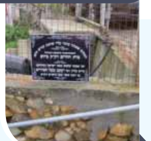
מצבת זכרון לרבי יעקב בעל הטורים, שהנחה על ידי אגדת 'אהלי צדיקים' בבית הקברות היהודי באי כיוס

רבי יעקב התפרסם כ'בעל הטורים' על שם ספר היסוד ההלכתי שכתב, המתחלק לארבעה 'טורים': ארץ חיים, יורה דעה, חשן משפט ואבן העזר. כמו כן חבר פרוש על התורה, כשהוא מקדים לכל פרשה פרפראות וגימטריות. מדפיסי החמשים הדפיסו רק את הפרפראות והגימטריות תחת