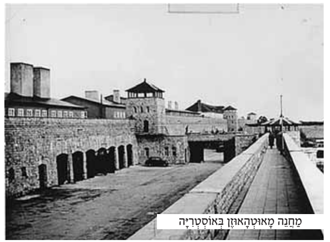
מחנה מאוטהאוזן באוסטריה

כתמורה לשמוש בסדור דרש האיש מכל אחד מחצית ממנת הלחם היומית שלו. מנת הלחם כלה היתה זעומה ביותר, ואותם יהודים נאלצו להפרד ממחציתה ולרעב עד סכנת חיים, בשביל תאות הבצע של אותו רשע מרשע.