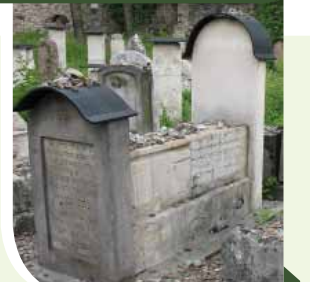
צינו של המגלה עמקות בבית החיים הישן בקראקא