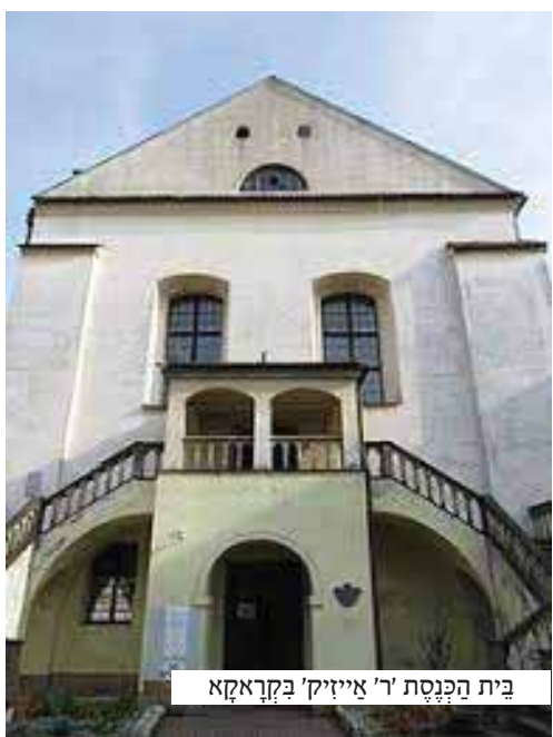
בית הכנסת 'ר' אייזיק' בקראקא

החליטו השנים לגשת אלי ולשאל את פי; 'האם אינך רוצה ללמד?' שאלתי את ר' ראובן, 'בודאי שאני רוצה' - השיב, 'אך את העסקה אבטל, כי היא מקח טעות.' 'ומדוע?' שאלתי, והספור שספר לי ר' ראובן רגש אותי עד דמעות: