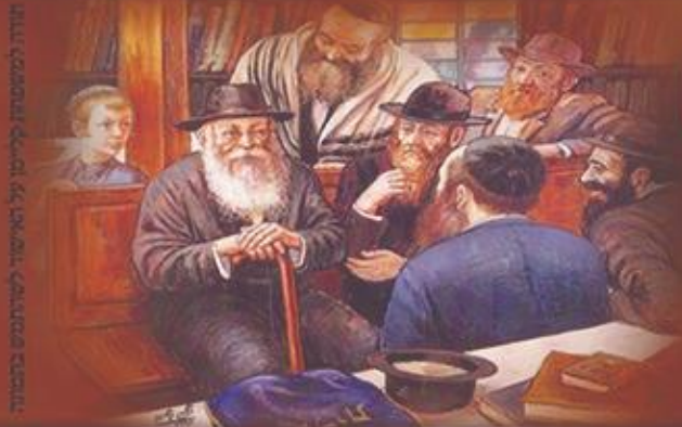
יורד למסעות קייטום על האישור לפרשת פ"ה