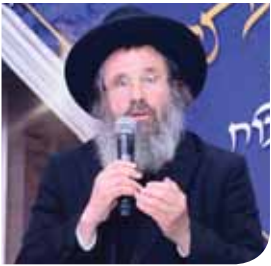
הגאון רבי דוד כהן שליט"א ראש ישיבת חברון

אמונה, שהקדוש ברוך הוא עושה הכל, משפיע הכל ומידו הכל. זהו היסוד של "צדיק באמונתו יחיה" (חבקוק ב ד) שעליו העמיד חבקוק את כל התורה, וזהו יסוד כל עבודת האדם.