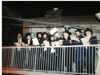
רבינו בעת ברכת הלבנה

שהרי טעם ההכרזה של זמן המולד בשבת שמברכים בה את החודש אינו מצד הדין, אלא כדי שידעו את מתי מותר לברך על הלבנה, והיות שבין כך בדרך כלל הציבור אינו מתעכב לברך את הלבנה עד לרגע האחרון, לא תצא כל תקלה בהכרזה שאינה מדויקת (אבי הישיבות 316 מפי רבינו).