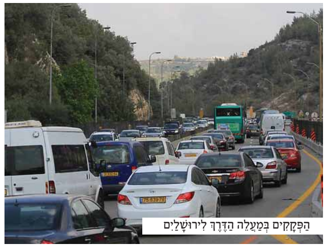
פקקים במעלה הדרך לירושלים

משך כמה שניות התלבטתי בדבר, ואז התעשתי, כאשר לפתע הכתה בי תובנה עמוקה: הרי כל התלבטותי נובעת מחמת החשש לאחר לפגישה שנקבעה לי עם אנשי רשות המסים; היעלה אפוא על הדעת שמפאת כבוד בשר ודם אפגע מלקיים את קביעותי לעגית אמן - וכי לא יהיה כבוד שמים חשוב בעיני כבוד בשר ודם?!