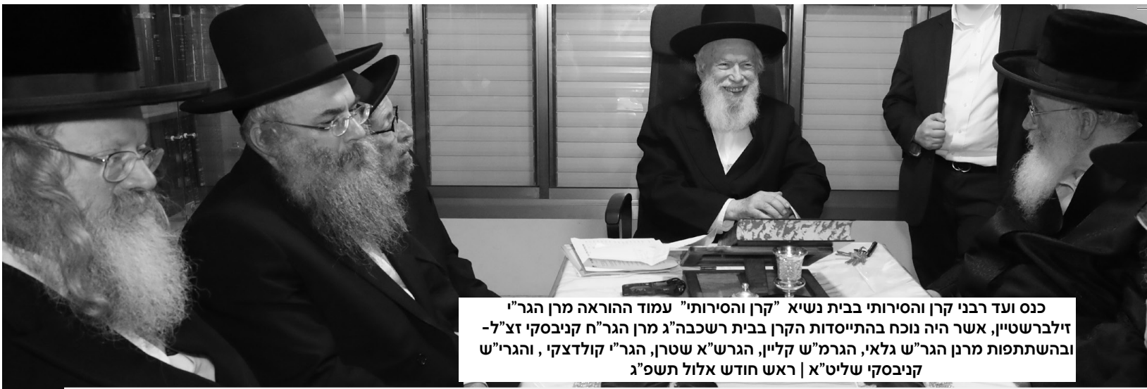
כנס ועד רבני קרן והסירות בבית נשיא "קרן והסירות" עמוד ההוראה מרן הגר"זילברשטיין, אשר היה נוכח בהתייסדות הקרן בבית רשכבה"ג מרן הגר"ח קניבסקי זצ"ל-ובהשתתפות מרן הגר"ש גלאי, הגר"מ"ש קליין, הגר"ש"א שטרן, הגר"י קולדצקי, והגר"ש קניבסקי שליט"א | ראש חודש אלול תשפ"ג