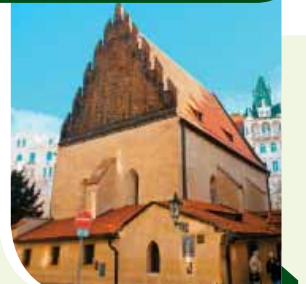
בית הגנות אלט גו' בפראג