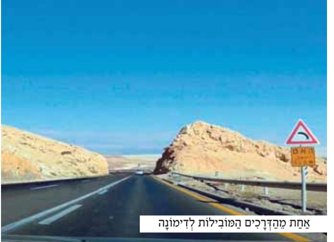
אחת מהדרכים המובילות לדימונה

נו, איך אפשר לסרב ליהודי הזקוק לעזרה?! חושב הרב ד' לעצמו, וממחשבה למעשה: הוא עוצר בצד הדרך ויוצא מהרכב. רק לאחר שיצא מרכבו הצליח להבחין בחזותו המחשידה של הנהג.