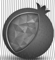
כתיבה וחתימה טובה