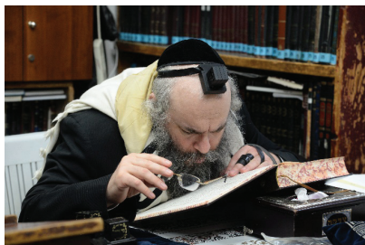
רבי שאול קניבסקי שליט"א

כשהדברים הגיעו לאוזניו של הרופא, נהנה ואמר בישרות: זו הפעם הראשונה שאני כותב מרשם ומישהו לוקח את זה במדויק.... ורבינו נהנה מאוד מעובדא זו וקלסיה.