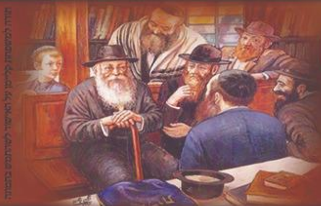
יחיד למשפחה קיימין על האישור לפרויקט ב"מבית